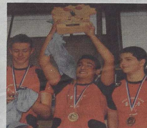
TROIS JEUNES. Champions de France par équipe à Toulon en 2010. Photo: Claude Bustin

NOUVELLE SALLE. Après le déménagement rue Brillat-Savarin. Photo: Claude Bustin