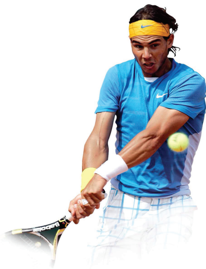
Rafael Nadal, Top Ten ATP

De fait, INDIBA® activ est en partenariat avec l' INSEP Médical , la FFA , la FFHB , le FC Barcelona et a été choisi par la Commission Médicale du Comité Olympique Français .