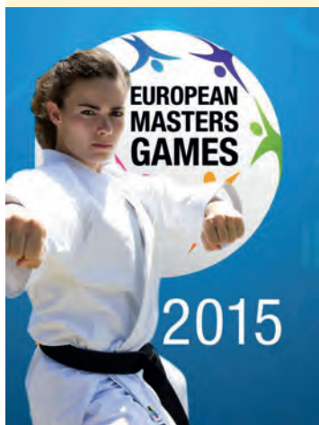
Sonia FIUZA KARATÉ Championne d'Europe