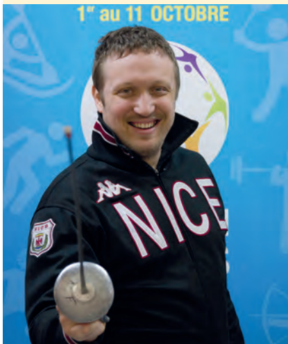
Jean-Noël FERRARI ESCRIME Champion Olympique en 2000