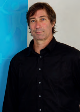
Laurent TILLIE VOLLEY-BALL Vice-Champion d'Europe en 1987