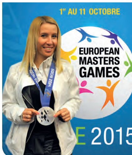
Cécile HERNANDEZ-CERVELLON SNOWBOARD HANDISPORT Vice-Championne Olympique en 2014