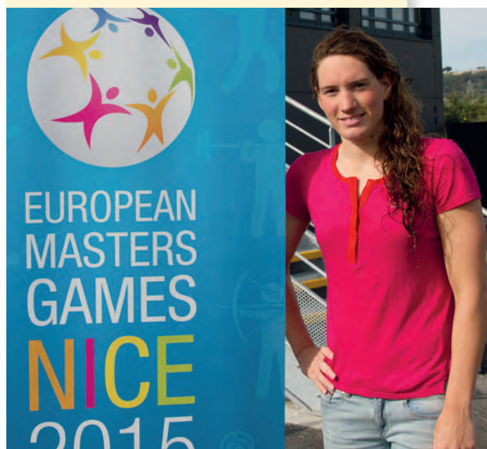
Camille MUFFAT NATATION Championne Olympique en 2012