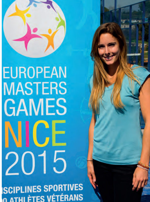
Alizée CORNET TENNIS 4 titres WTA (11ème mondiale en 2009)