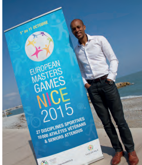
Stéphane DIAGANA ATHLÉTISME Champion du Monde 400m haies en 1997