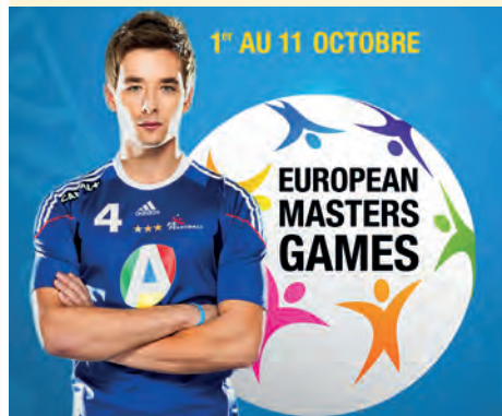
Xavier BARACHET HANDBALL Champion Olympique en 2012