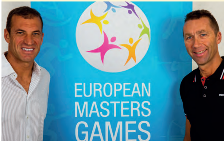
Christophe PINNA KARATÉ Champion du Monde en 2000