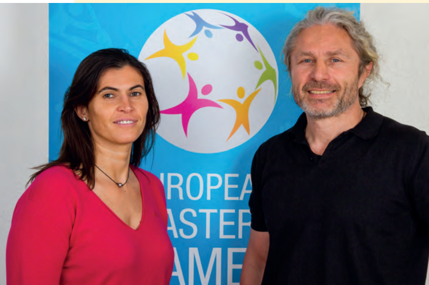
Valérie NICOLAS HANDBALL Championne du Monde en 2003