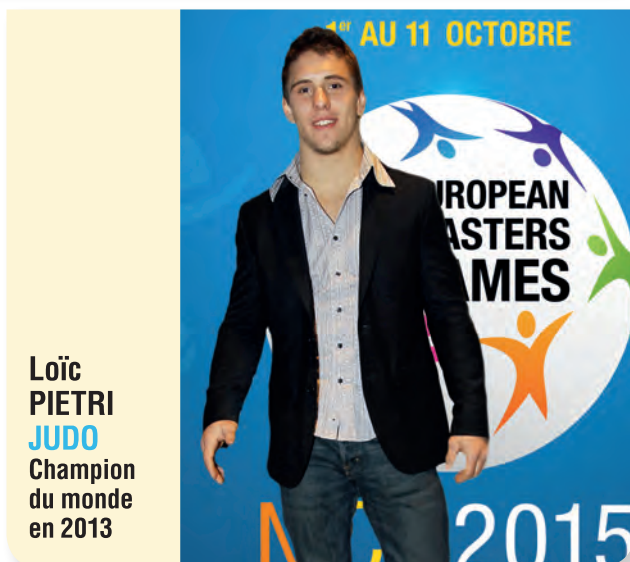
Loïc PIETRI JUDO Champion du monde en 2013