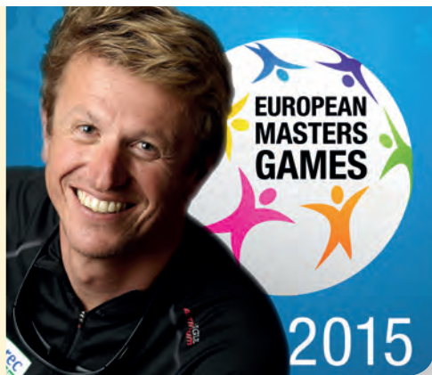
Jean-Pierre DICK VOILE 3 fois vainqueur de la Transat Jacques Vabre