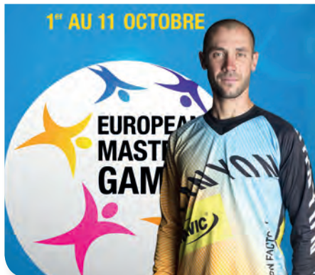
Fabien BAREL CYCLISME (VTT) Champion du monde en 2004 et 2005