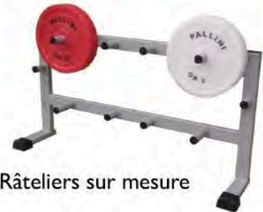
Râteliers sur mesure