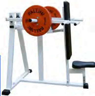
Presse à épaules A charge libre

Merci de votre confiance et de votre fidélité