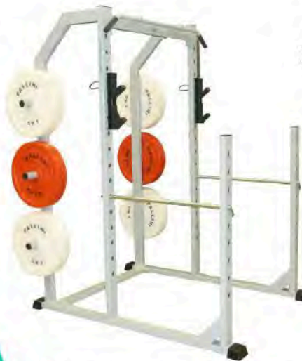
Cage à squat avec barre de traction, jeu de sécurité et râtelier à disques intégrés.